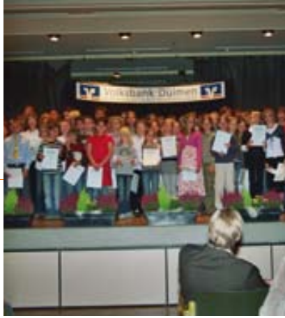
Nachwuchsförderung: Seit 23 Jahren zeichnet die Volksbank Dülmen Musikschüler mit Förderpreisen aus.