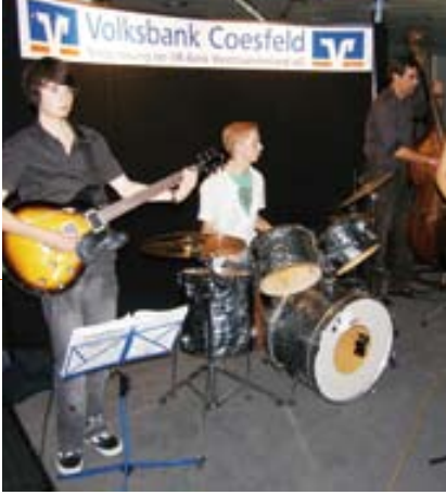
Musik ist Dialog: In der ersten Coesfelder Kulturnacht spielten und sangen Musikschüler in der überfüllten Volksbank an der Kupferstraße.