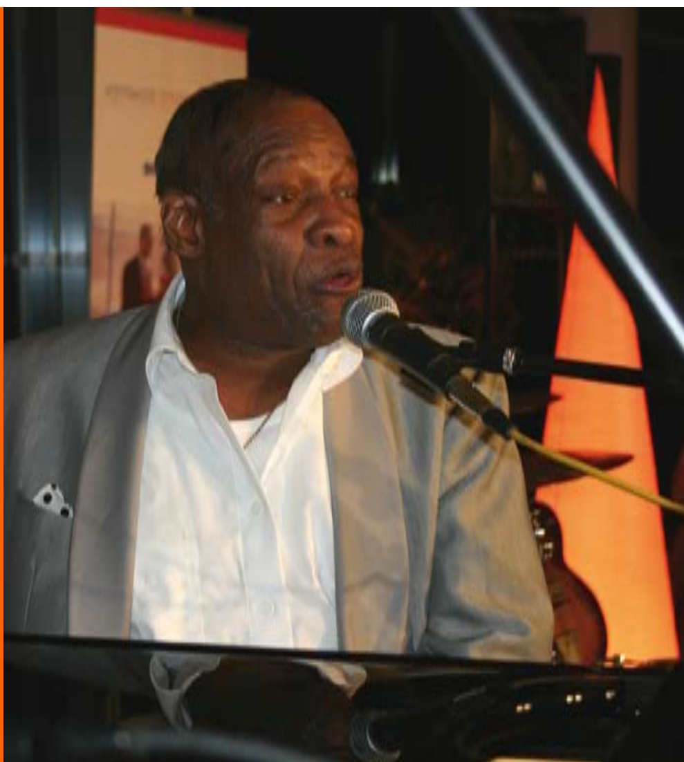
Voller Energie: Little Willie Littlefield, Stargast beim 9. Internationalen Blues- & Boogie-Festival der VR-Bank Westmünsterland und den Stadtwerken Coesfeld

Kulturnächte, Literaturtreffen, Musikschulwettbewerbe, Jazz-Festivals – Kulturarbeit ist für die VR-Bank Westmünsterland nicht Verpflichtung, sondern Herzensangelegenheit.