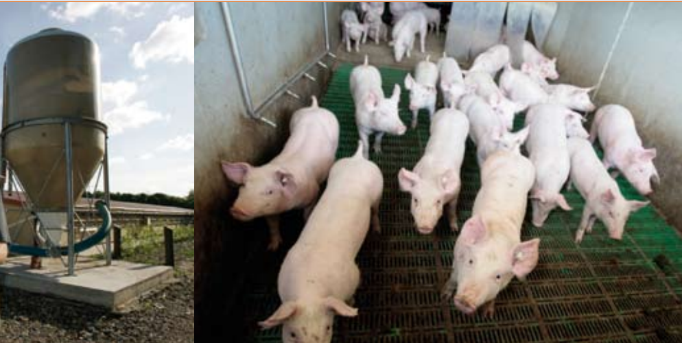
Flatdeck: 24 Tage nach der Geburt werden die Ferkel von der Mutter getrennt.

treide an. Um den Hof zukunftssicher zu machen, hat er sich mehr und mehr auf die Ferkelerzeugung spezialisiert und seinen Hof nach und nach aufgerüstet.