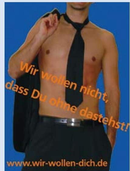
Frech: Auszubildende werben Auszubildende mit Krawatte und nacktem Oberkörper.

Weitere Informationen zu der Kampagne finden Sie unter www.vr-bank-westmuensterland.de